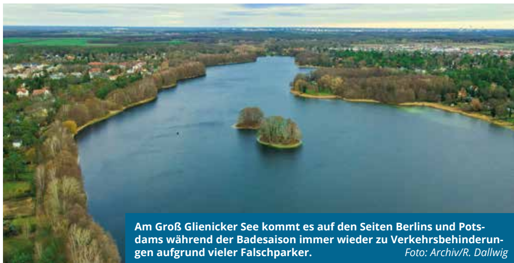
Am Groß Glienicker See kommt es auf den Seiten Berlins und Potsdams während der Badesaison immer wieder zu Verkehrsbehinderungen aufgrund vieler Falschparker.

In einem ersten Schritt wird eine temporäre Einbahnstraßenregelung mit Haltverboten auf beiden Seiten in Fahrtrichtung Krampnitzer Weg errichtet. Diese Regelung gilt vom 26.05.2023 bis voraussichtlich zum 30.09.2023 zwischen der Uferpromenade 42c/42b und der Zufahrt zum Parkplatz Nr. 19 (Bereich Badewiese). „Das Ziel von Bezirksamt und Polizei ist es,