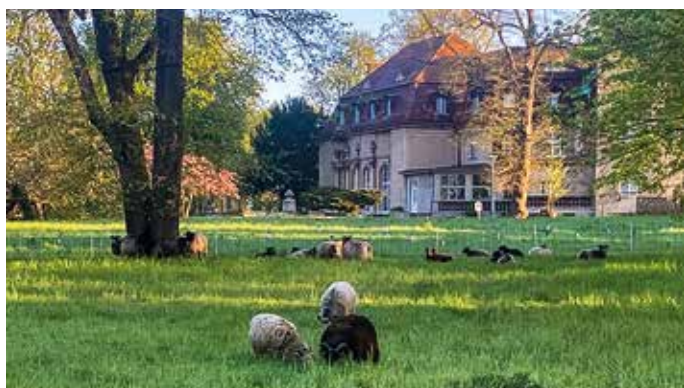
Schafe pflegen nun den Marquardter Park.