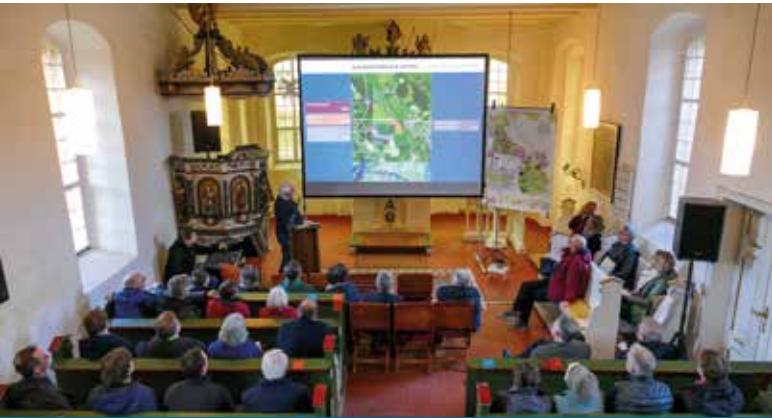
Präsentation der Ergebnisse des Dorfdialogs in der Satzkorner Kirche am 26.4.2023.

zahlreiche Punkte und wird demnächst umgesetzt.