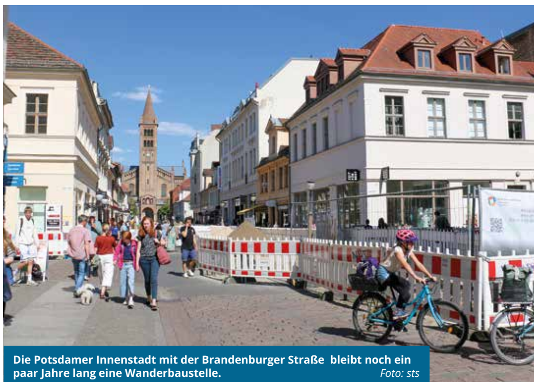
Die Potsdamer Innenstadt mit der Brandenburger Straße bleibt noch ein paar Jahre lang eine Wanderbaustelle.