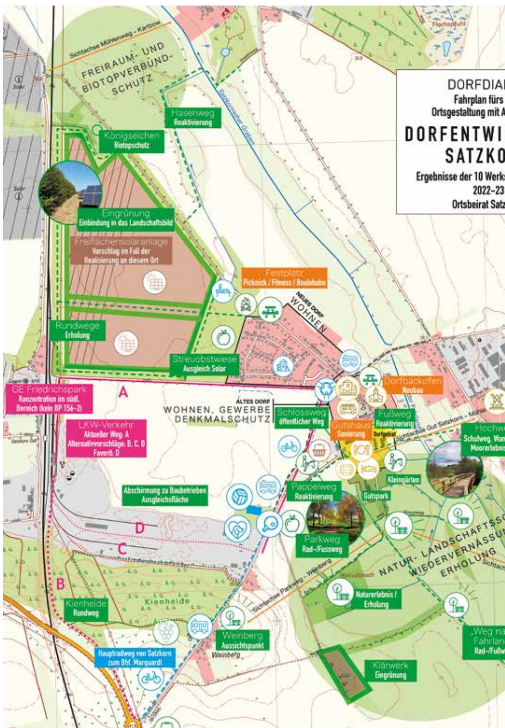
Dorfdialog Satz Korn, Planzeichnung des Konzepts.