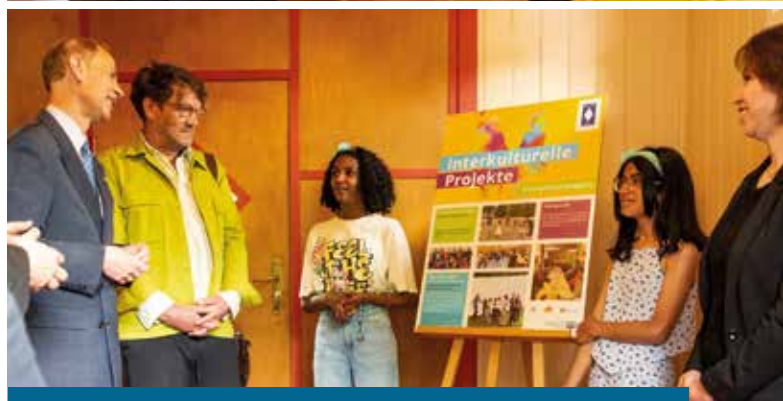
Ob bei der Enthüllung der Plakette, die an seinen Besuch erinnern soll, bei Gesprächen im Haus mit den Nachkommen der Familie Alexander oder bei der Präsentation integrativer Schülerprojekte, Prinz Edward zeigte sich bei seinem Besuch am 23. Mai in Groß Gliencke gut gelaunt und sehr interessiert. Mit seinem sympathischen und nahbaren Auftreten nahm er den Anwesenden schnell die Kontaktscheue und hinterließ einen bleibenden Eindruck.