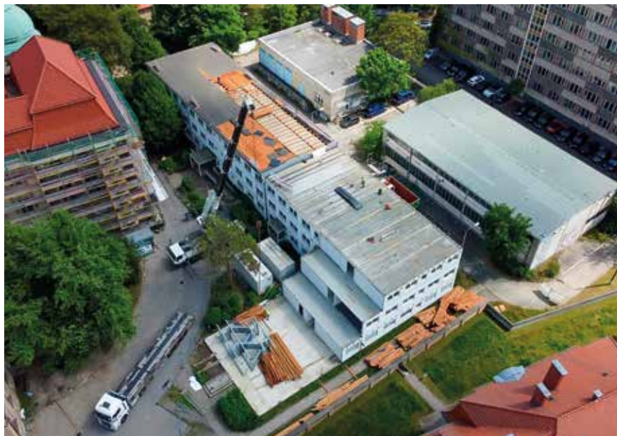
Baufortschritte auf dem Verwaltungscampus

Ab September sollen rund 450 Mitarbeitende in den neuen Interimsstandort in der Edi-