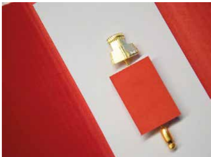
Die Spandauer Ehrennadel ist die höchste bezirkliche Auszeichnung für persönliches Engagement.